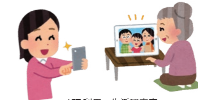
ICT利用・生活研究室

定員 16名 対象 小学生以上 参加費 無料 時間 15:00-17:00 持ち物 パソコン又はタブレット又はスマホ