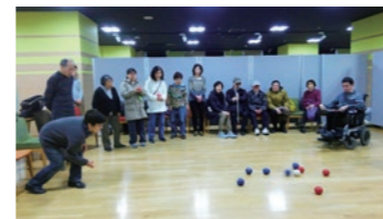
柏市心身障害者福祉連絡協議会