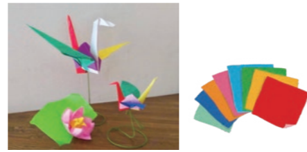
柏シルバー大学院

定員 18名まで 対象 どなたでも ※混雑時はお待ちいただく場合があります 参加費 無料 時間 15:00~17:00