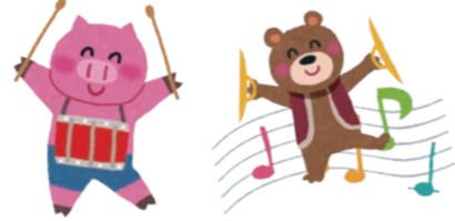
Drum Circle - Beat at Kashiwa - DCBK