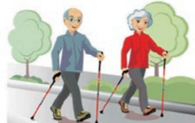
柏の葉ポールウォーキングクラブ

定員 16名 対象 どなたでも(医者から運動を止められてない方) 参加費 500円 時間 10:00~12:00 持ち物 飲み物、タオル、手袋、帽子、マスク、リュックまたはポーチ(両手がふさがらないもの)