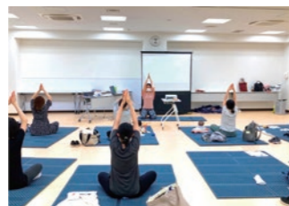
ママのカラダケア Labo