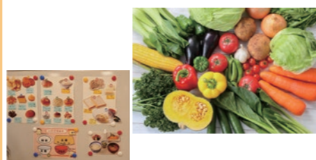
東葛北部認定栄養ケア・ステーション