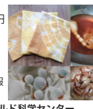
千葉大学環境健康フィールド科学センター NPO エコグリーン協会

15:30-17:00 参加費 1000円 定員 10名 対象 5歳以上 ※未就学児は保護者同伴