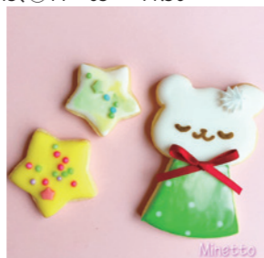
アイシングクッキーミニネット

①10:00~10:45, ②11:05~11:50 定員 各回 15組 対象 3歳以上 参加費 1人 1200円 持ち物 汚れが気になる方はエプロン