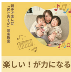
親子で楽しむ「おとあそび」音楽教室

定員 各回 10組 参加費 1組 1500円 ご兄弟の参加は+500円 持ち物 ・飲み物 ・動きやすい服装