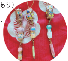
もりより (mori-yori) 自然かんたん研究室

①15:15~②16:00 定員 各回 3名 参加費 1000円 対象 3歳以上 ※未就学児保護者同伴