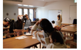
ヨガと手作りパンサークル

①10:00~10:30 ②10:45~11:15 ③11:30~12:00 定員 各回 10名 参加費 600円 対象 どなたでも 持ち物 飲み物・動きやすい服装 お子様が参加する場合 お子様に必要のもの