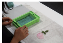
NPO 法人かしわ環境ステーション

13:00-14:30 定員 8組 16名 対象 小学生以上 ※小学生は必ず保護者同伴 参加費 無料