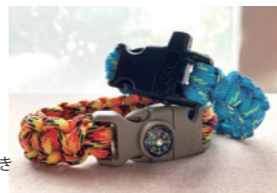
ママ & キッズセミナー

①10:00~②11:00 定員 各 10名 対象 小学生以上 参加費 ・1000円 ※方位磁石 ・1200円 火打石つき