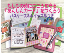
ママ & キッズセミナー

①10:00~10:30 ②10:40~11:10 ③11:20~11:50 定員 各回 6組 参加費 800円 対象 どなたでも 持ち物 カードを所持する予定の人物が写っている、5x8cmくらいの写真1枚