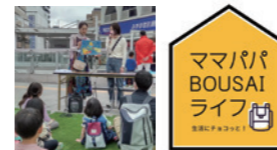
ママコミュニティ (L E:) ママパパ BOUSAI ライフ

10:30~11:30 定員 30名 対象 乳幼児~小学生くらいまでの親子 参加費 無料