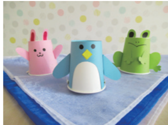
はぐはぐひろば沼南

10:00~12:00 ※材料がなくなり次第終了となります。 参加費 無料 対象 乳幼児とその保護者