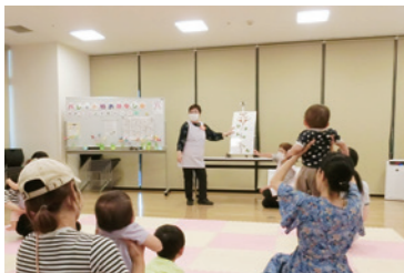
(特) NPO こどもすべす柏