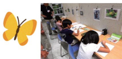
NPO 法人かしわ環境ステーション

13:00~14:20 定員 10名 対象 小学生以上 ※小学2年生以下は保護者同伴 参加費 無料