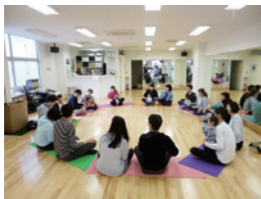
ニコママスタジオ

10:15~11:15 参加費 1組 500円 対象 乳幼児とその保護者 定員 10組 持ち物 お使いの抱っこ紐