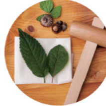
もりより (mori-yori) 自然かんたん研究室

①15:30~②16:15 定員 各回 3名 参加費 1000円 対象 3歳以上 ※未就学児保護者同伴